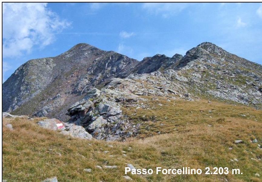
Passo Forcellino 2.203 m.