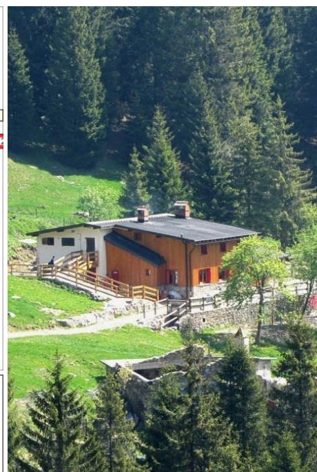
Rifugio Alpe Corte