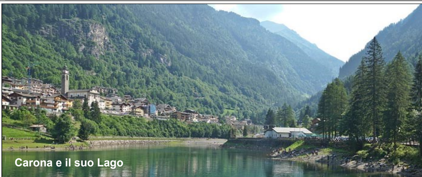
Carona e il suo Lago

ZAINO, SCARPONCINI o PEDULE ( NO scarpe da ginnastica ), MAGLIONE o PILE LEGGERO, GIACCA ANTIVENTO, MANTELLINA o OMBRELLO PORTATILE, BORRACCIA CON ACQUA, UTILI I BASTONCINI ( meglio se telescopici ), OCCHIALI DA SOLE, CREME SOLARI - RICAMBI DA LASCIARE IN PULLMAN