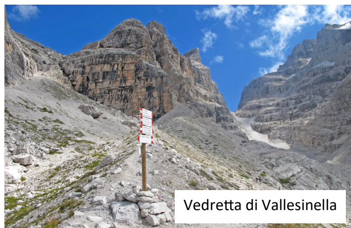
Vedretta di Vallesinella