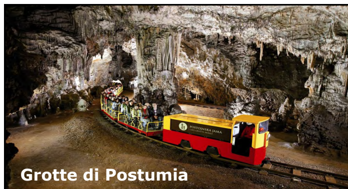
Grotte di Postumia