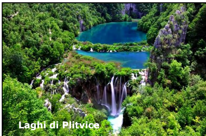
Laghi di Plitvice