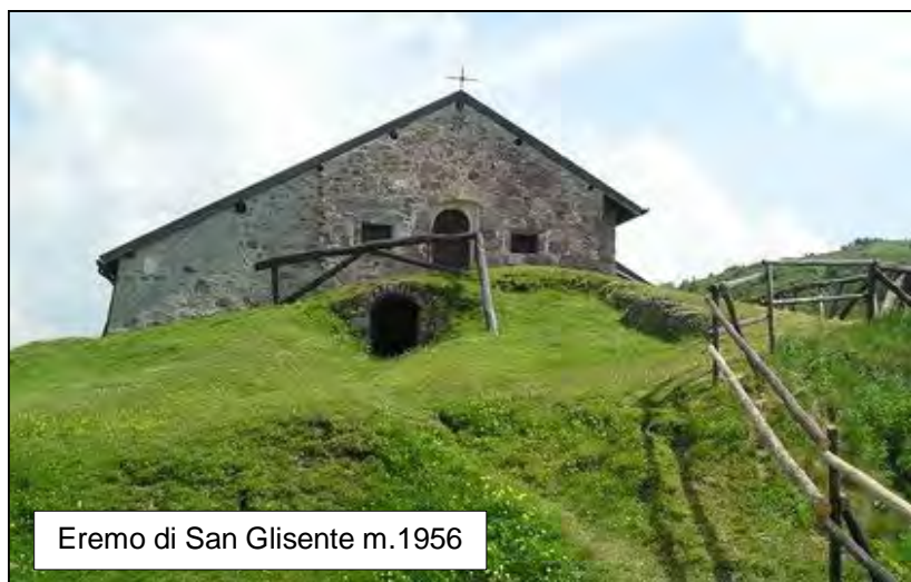
Eremo di San Glisente m.1956