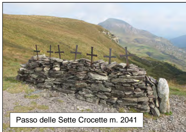
Passo delle Sette Crocette m. 2041