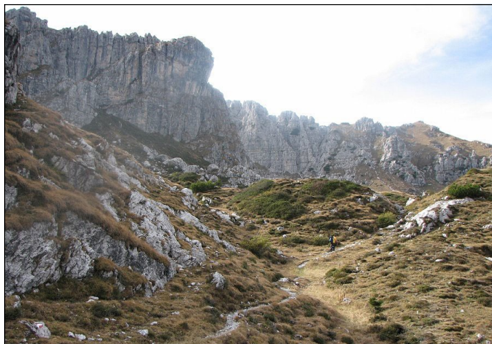
Tratti del sentiero degli Stradini allo Zuccone Campelli