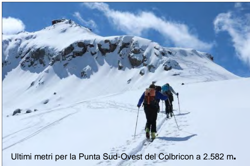
Ultimi metri per la Punta Sud-Ovest del Colbricon a 2.582 m.

Il programma potrà subire variazioni in relazione alle condizioni meteorologiche e dell'innnevamento a giudizio insindacabile dei coordinatori