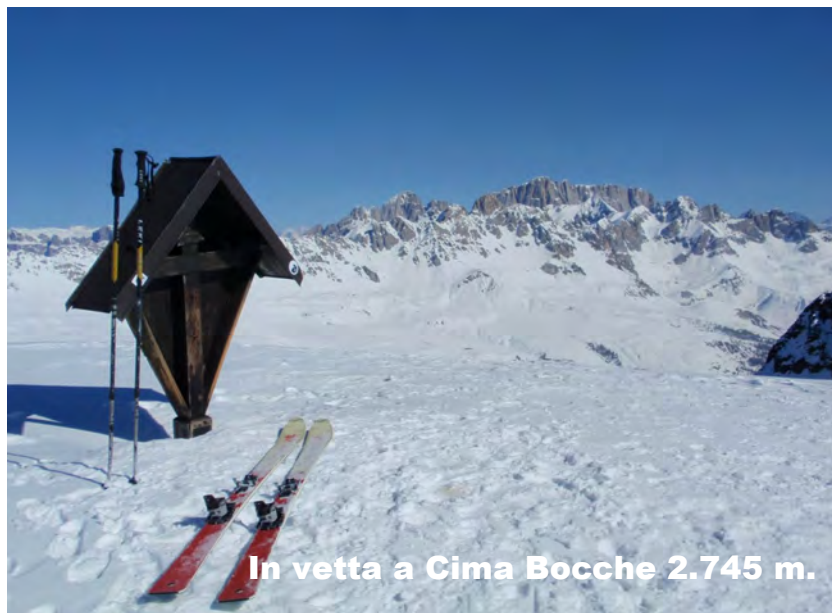
In vetta a Cima Bocche 2.745 m.

Non soci : + 14,00 euro per Assicurazione C.A.I.