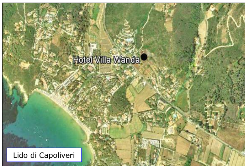
Lido di Capoliveri