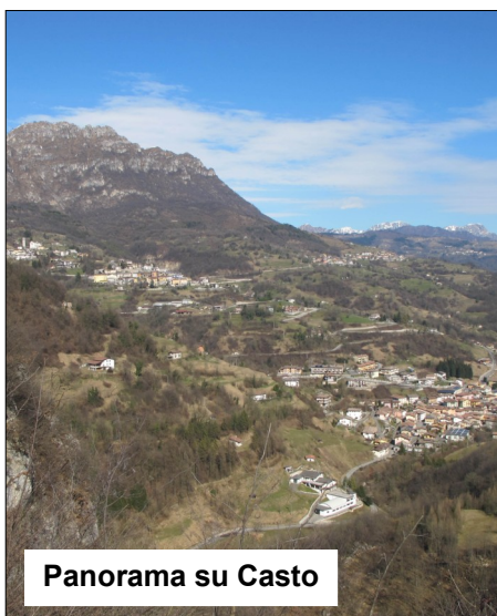
Panorama su Casto