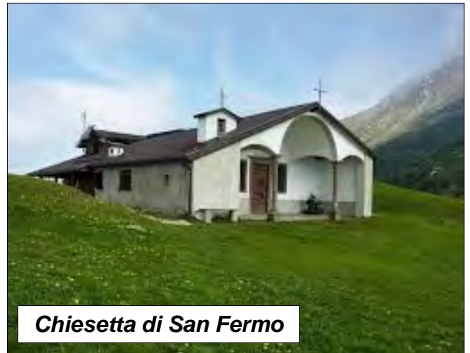
Chiesetta di San Fermo