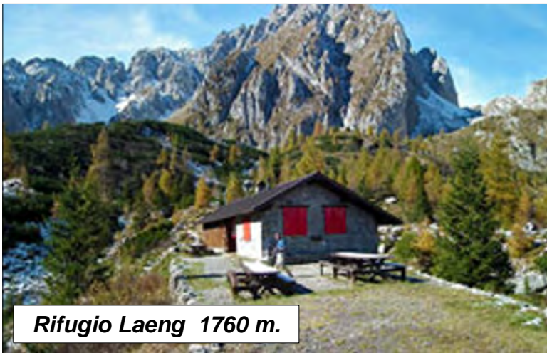
Rifugio Laeng 1760 m.