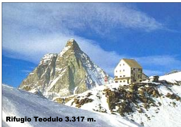
Rifugio Teodulo 3.317 m.