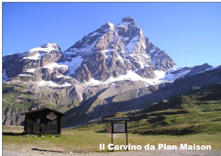
Il Cervino da Plan Maison