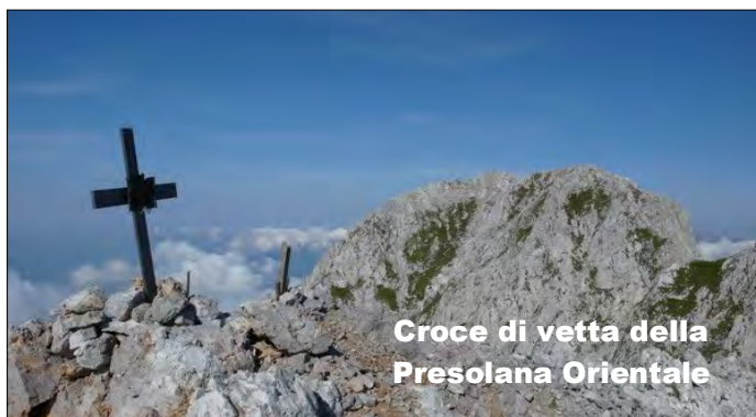
Croce di vetta della Presolana Orientale