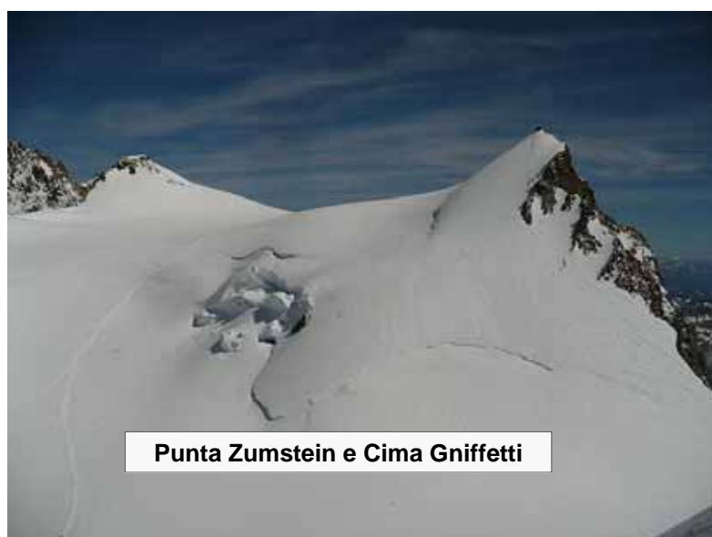
Punta Zumstein e Cima Gniffetti