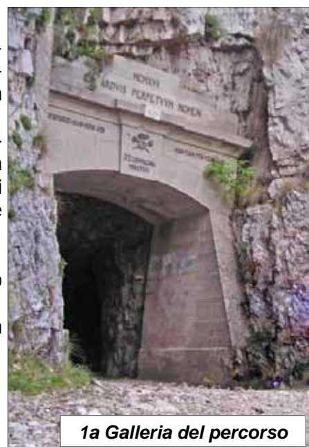
1a Galleria del percorso

Inizio iscrizioni per soci 25/8; per non soci 8/9