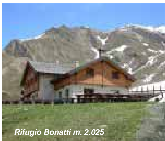
Rifugio Bonatti m. 2.025

Ingresso a pagamento con guida; gratuito per chi ha compiuto i 65 anni e i minori di anni 18