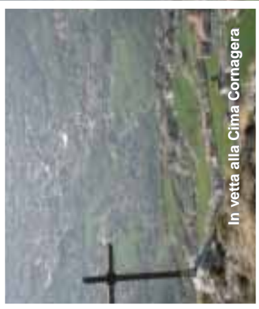
In vetta alla Cima Cornagiera