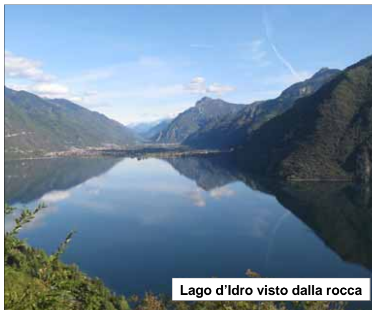
Lago d'Idro visto dalla rocca

La visita si svolge in parte all'esterno su scalinate, camminamenti e stradine e parte in locali all'interno di edifici; non presenta difficoltà (circa 300 m. di dislivello)