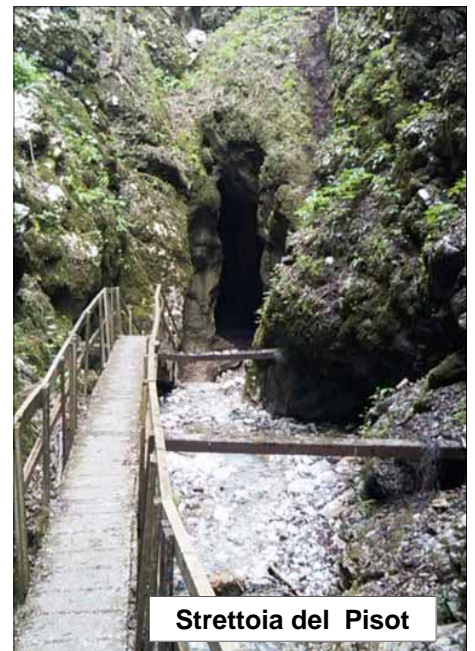
Strettoia del Pisot