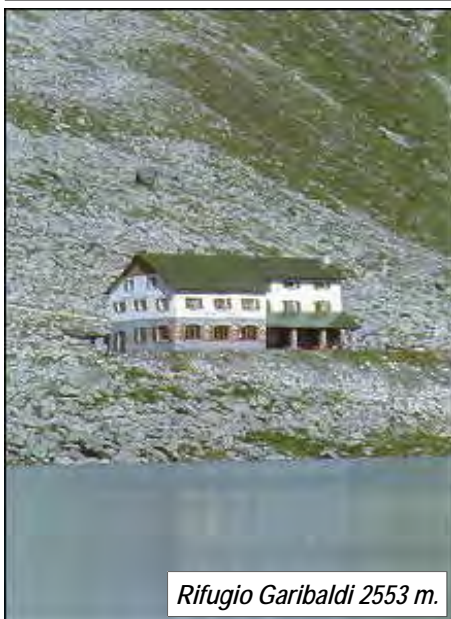
Rifugio Garibaldi 2553 m.

Percorso escursionistico senza difficoltà