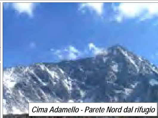
Cima Adamello - Parete Nord dal rifugio

I coordinatori non hanno alcuna responsabilità, in particolare per fatti derivanti da imprudenza o imperizia dei soci; i partecipanti esonerano i coordinatori e la Sezione CAI Lumezzane da ogni responsabilità per qualsiasi incidente dovesse verificarsi durante lo svolgimento dell'escursione.