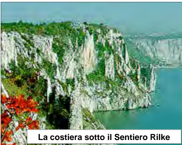
La costiera sotto il Sentiero Rilke