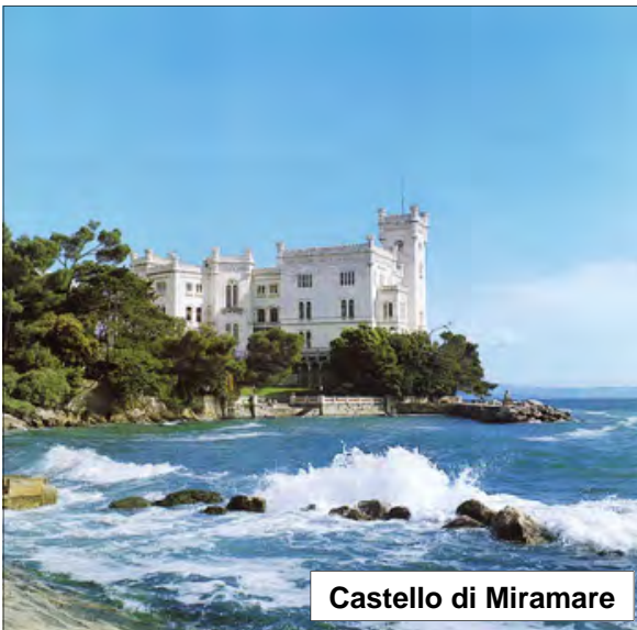
Castello di Miramare